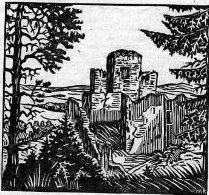
28 Hrad Rokštýn. (Titulní linoleoryt z připravovaného průvodce.)

Konečně bylo tedy započato s přístavbou a již letos bude předána svému účelu budova tak potřebná pro lepší budoucnost školství nejen Luk, nýbrž i okolí.